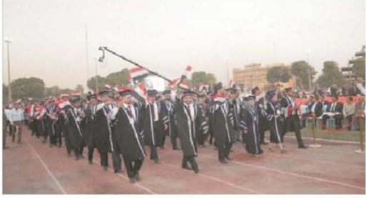
طلبة جامعة بغداد يمشون في طابقتهم خلال حفل تخرجهم.

لاي كان، ان يوقف زحف التحضر الحديثة في كل مساحات عراقنا الحبيب" مؤكداً ان فوزرة هيات كل المستلزمات الضرورية التي تجعل من التعليم العالي في العراق قسطاً لا تاج ملاكات كسفرة على وكولو جيا، وتكون جيا، وتضمن فصل رئيس جامعة بغداد، الدكتور جلال عه الحسين ان الجامعة ماضية بتقديم أفضل الطاقات والخبرات في خدمة المجتمع كمشروع في مجالات علمية، فضلاً عن التوسع في خطة الدراسات العليا لتتضمن فيول