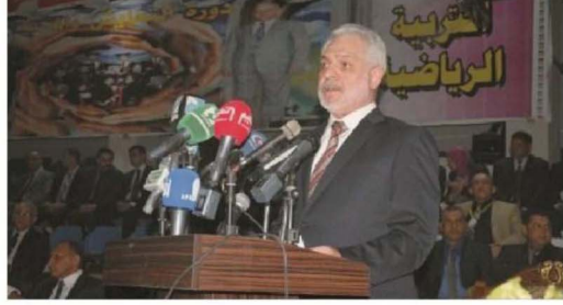
وزير التعليم العالي والبحث العلمي على الأديب، يخطب أمام طلبة جامعة بغداد في حفل تخرجهم.

قال وزير التعليم العالي والبحث العلمي على الأديب، ثنا يزيد من طلبة الجامعات ان يكونوا اداة التغيير في المجتمع لمستقبل مشرق، وحاملي للواء الحبة والسلام والشارين للوعي والروح والشجاعة وتفانيهم بين شرائح المجتمع ومكوناته مؤكداً ان وحدة البلاد امانة في اعناق الطلبة. جاء ذلك في كلمة تليها وزير التعليم العالي خلال عرشته كخروج الدورة ٥٠٠٠ لطلبة جامعة بغداد في دورة (التعبئة والمحبة) للعام الدراسي الحالي ٢٠١٢-٢٠١٣ بحضور عدد من أعضاء مجلس النواب والسفراء وجمع كبير من عمال الطلبة المتخرجين. وأضاف الأديب ان " العراق يمر في مرحلة التحول من ثقافة الاستبداد والقضاء الاخر الى ثقافة الديمقراطية والتعبير عن الحرية، على الرغم من المحاولات اليائسة لإيقاف عجلة التقدم العلمي في العراق، كما التهمت في الهجمات التي اطلقتها من يريد اعادة العراق الى حقبة الاستبداد والتفكك الشمولي. وأشار الأديب في كلمته ان " الاختلافات السياسية التي يريدها الشعب والجمهورية العراقية هي اداة التغيير في المجتمع والوطن، وهي مهمة اعادة العراق الى مصاف الدول المتقدمة علمياً وسانياً، انطلاقاً من الإرث الحضاري الذي يخدم البناء العودى الى ما كان عليه العراق في السابق. وهذا وزير التعليم العالي الطيبه المتخرجين الذين تتكون من مرحلة التفرغ لتفسي العلوم والمعارف، الى