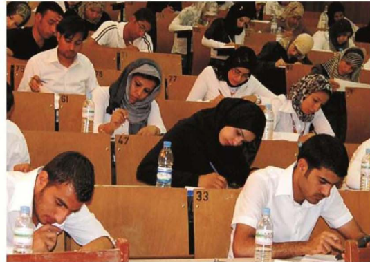
بغداد / التعليم العالي

وأعلنت وزارة التعليم العالي والبحث العلمي، ضوابط المقاصة العلمية للمقاصة العامة للجامعات الاهلية، للعام الدراسي 2013-2014. وأوضحت ضوابط المقاصة العلمية، أن أية اجراء المقاصة العلمية يبدأ من القسم العلمي المنقول اليه الطالب في الجامعات داخل العراق أو خارجه. وتضمنت الضوابط قبول الطالب في المرحلة الدراسية نفسها إذا كانت المواد الدراسية متطابقة بين الكليات المنقول منها إليها، أو مختلفة بدرجة المنقول فستقتضى ذلك إذا كان النظام الدراسي متطابقا، مبينة أنه سيتم خصم الطالب المادة أو المادتين المراديتين. وبينت الضوابط أنه إذا كان الاختلاف واللغة أو طرق التعليمات الامتحانية من مادتين مهتجين فإن الطالب يخسر